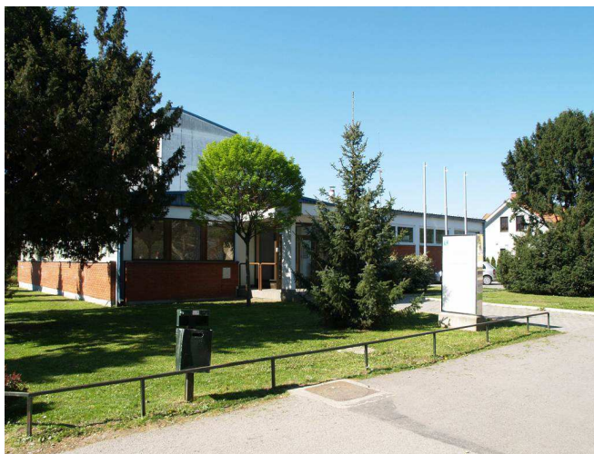
Slika 3 – Ulaz u Nekretninu