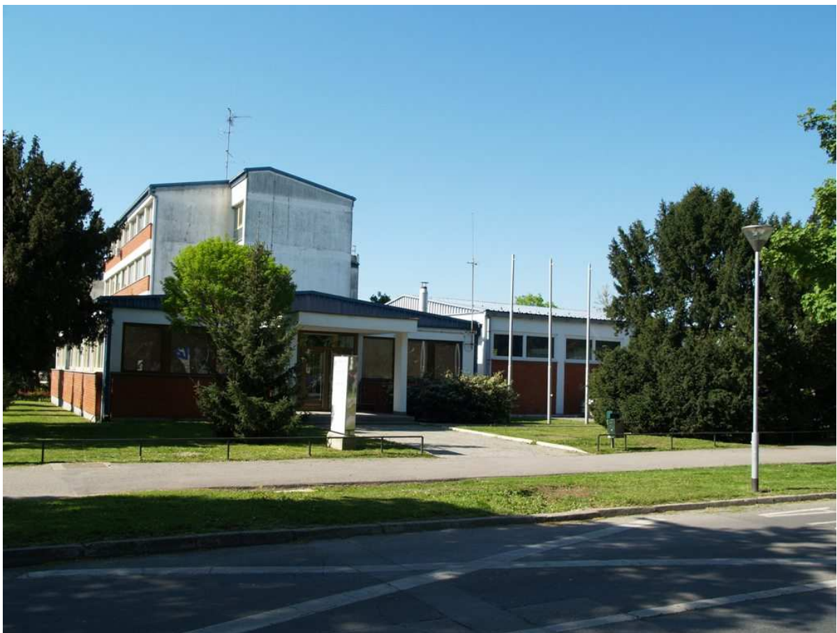
Slika 1 – Poslovna zgrada IGH, Hallerova aleja 7, Varaždin