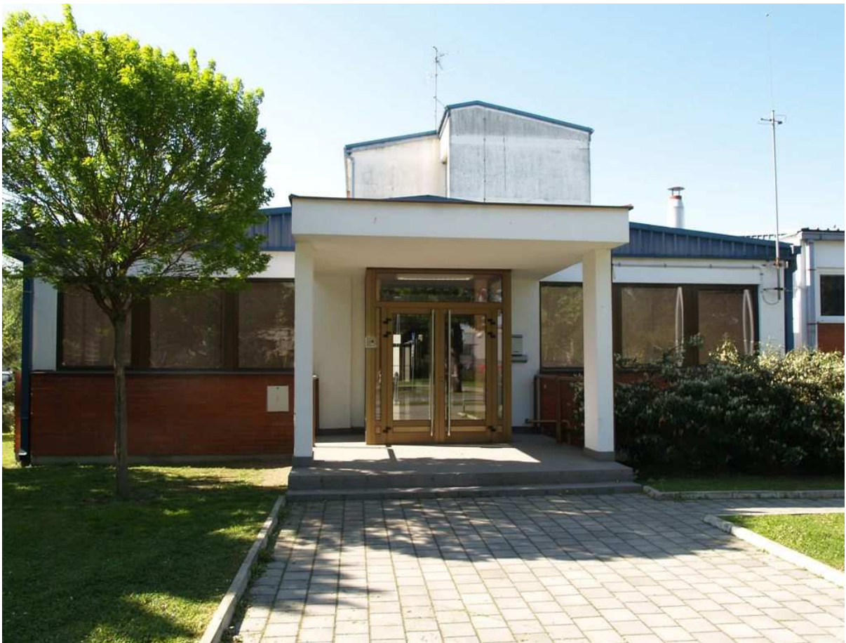
Slika 6 – Ulaz u Nekretninu

Nekretnina se nudi na prodaju po cijeni od 450.000 EUR (slovima: četrsto pedeset tisuća eura), uvećano za odgovarajući porez (sve plativo u kunama prema srednjem tečaju HNB d.d. na dan uplate).