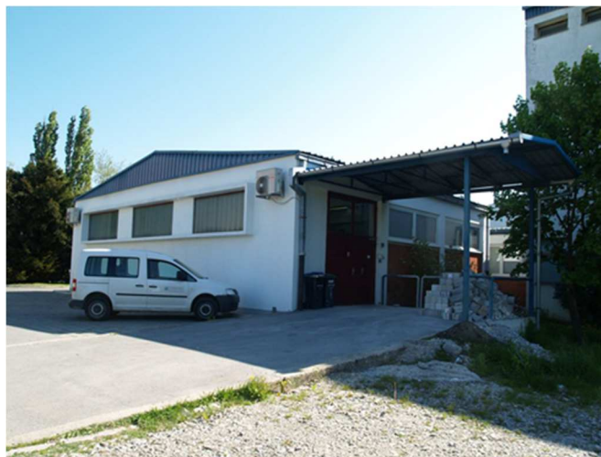
Slika 4 – Stražnji ulaz u Nekretninu